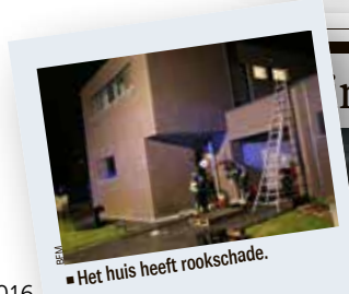
Het huis heeft rookschade.