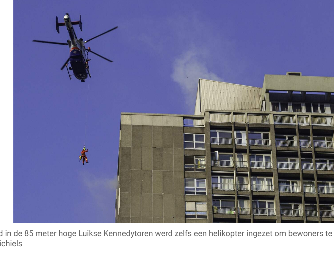
Bij de brand in de 85 meter hoge Luikse Kennedytoren werd zelfs een helikopter ingezet om bewoners te evacueren

Eind juni 2024 was er ook er in het centrum van Luik een zware brand in een woontoren van 28 verdiepingen. Het vuur en de rook wisten zich via de technische schachten te verspreiden. Drie bewoners van de zogenaamde Kennedytoren kwamen om, veertien mensen raakten gewond. Het hele gebouw werd onbewoonbaar verklaard. Pas eind vorig jaar konden de eerste bewoners terugkeren.