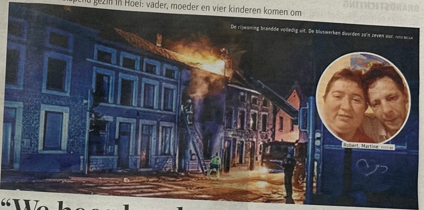
De rijwoning brandde volledig uit. De bluswerken duurden zo'n zeven uur.

Brand verrast slapend gezin in Hoei: vader, moeder en vier kinderen komen om