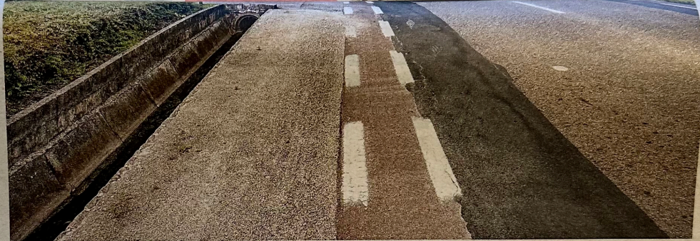
Een moordstrookje in Zandhoven, zoals er nog zoveel zijn in Vlaanderen.

"De snelheid waarmee de investeringen gebeuren, trekt de aandacht in heel Europa", verklaarde minister Peeters vorige week nog naar aanleiding van een Europese fietsconferentie in Hasselt. Daar pakte de liberale politica uit met de 1,4 miljard euro die ze de voorbije vier jaar heeft geïnvesteerd in fietsinfrastructuur. Maar van dat totale bedrag is op enkele maanden van de verkiezingen nog maar 463 mil-