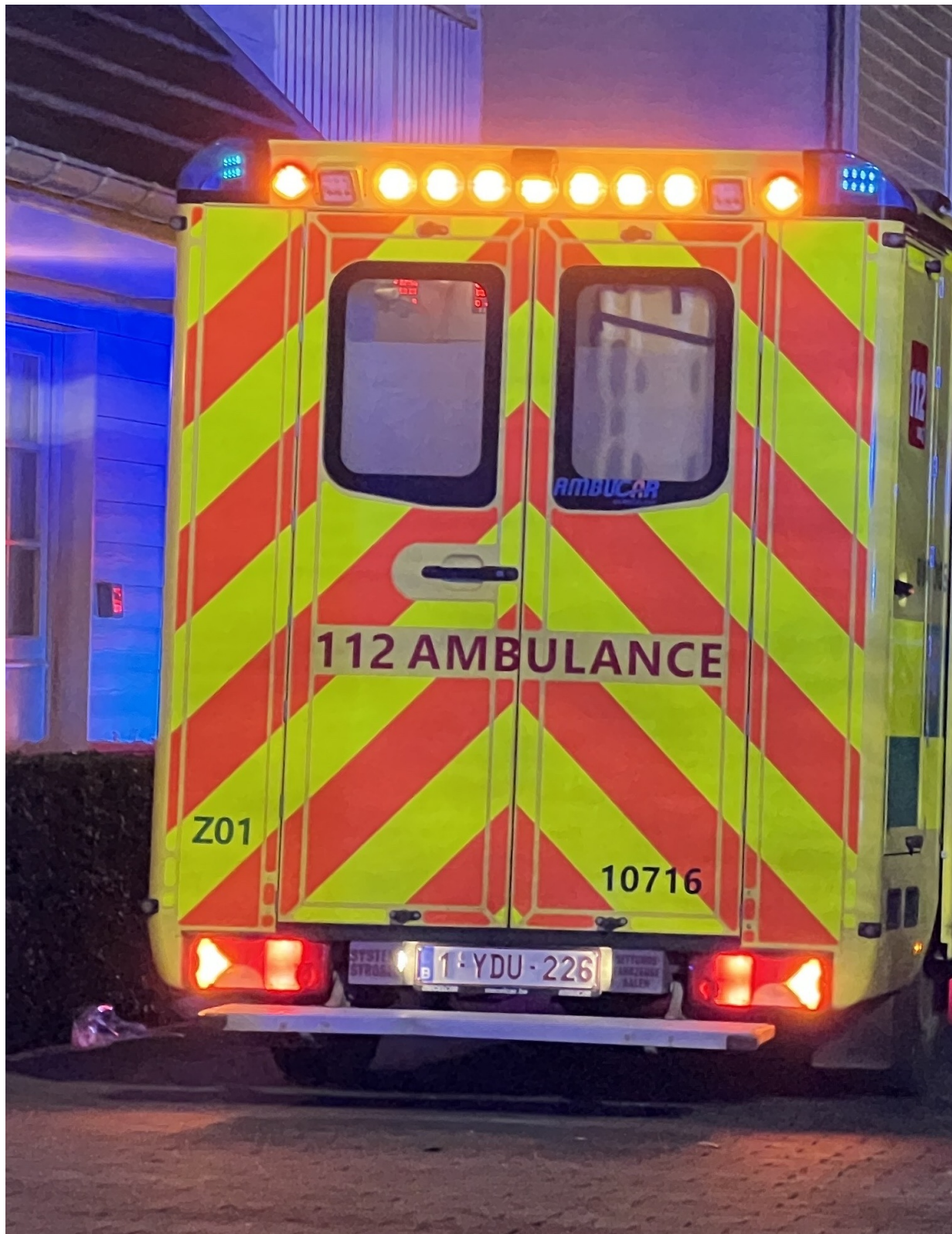
De hulpdiensten waren snel ter plaatse. Er werd nog lange tijd geprobeerd om de twee slachtoffers te reanimeren, maar er kjon geen hulp meer baten.