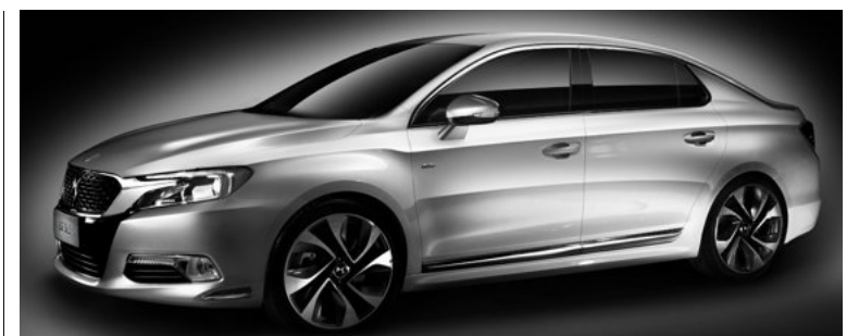
In China is de DS al een volwaardig merk, met een eigen dealernet en zelfs een eigen model, deze DS5LS.

Sinds Citroën de déesse in 2010 opnieuw tot leven wakte, verkocht het al 410.000 stuks van de DS3, DS4 en DS5, zo'n 18 procent van alle Citroëns. Volgens Tavares heeft PSA een premiummerk nodig om op te tornen tegen het Duitse luxesegment.