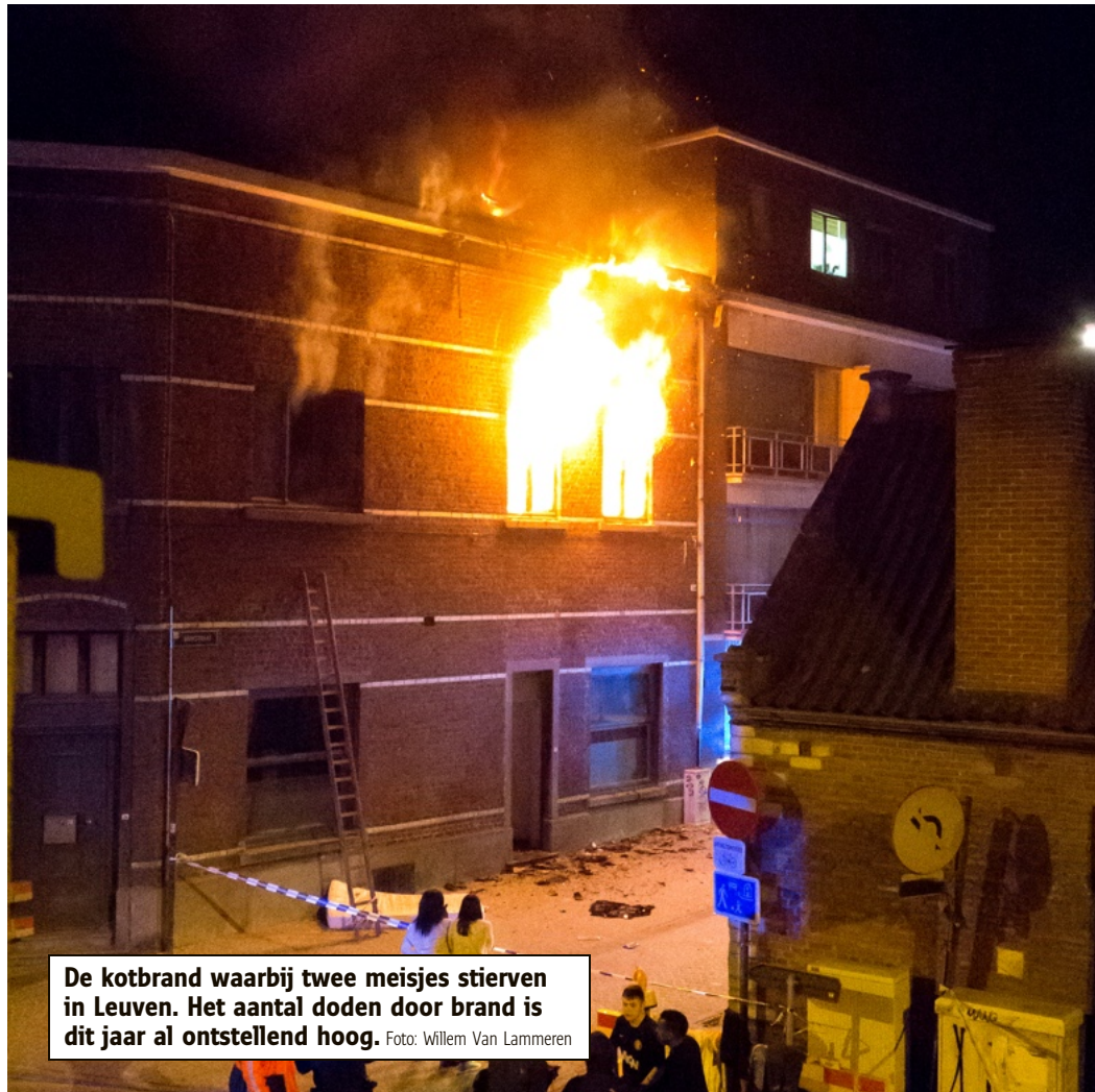
De kotbrand waarbij twee meisjes stierven in Leuven. Het aantal doden door brand is dit jaar al ontstellend hoog.

Renders is brandweerman in Leuven, en zelfstandig adviseur brandveiligheid. Hij houdt zelf een telling bij over de branden in ons land. 'Omdat de overheid dat al jaren niet meer doet.' Brandweer Vereniging Vlaanderen, de vakorganisatie, vraagt de regering al jaren daar opnieuw werk van te maken. Of er nu meer branden zijn dan vroeger, weet bijgevolg niemand.